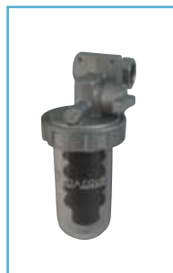
DOSATORE es: D/BLU/R by pass

OBBLIGATORIO con durezza temporanea < 25° F