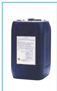
PROTETTIVO FILMANTE es: EUROCLEAR XS1

OBBLIGATORIO con durezza temporanea < 25° F