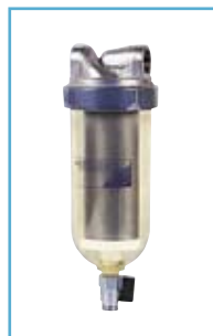
FILTRO es: LINDO/B

OBBLIGATORIO con durezza temporanea > 25° F