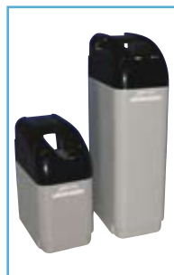
ADDOLCITORE es: CABINATO DIGIT_SEM17

OBBLIGATORIO con durezza temporanea > 25° F